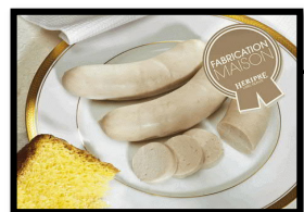
Boudin Blanc au Gateau Battu